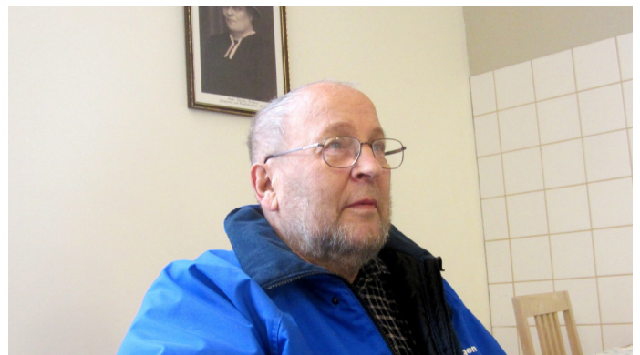
↑ ↑ Kahvia ja rupattelua happy hour-aikaan.